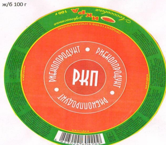
18. "Находка" Ікра лосося зерниста червона форель ж/б 100 г