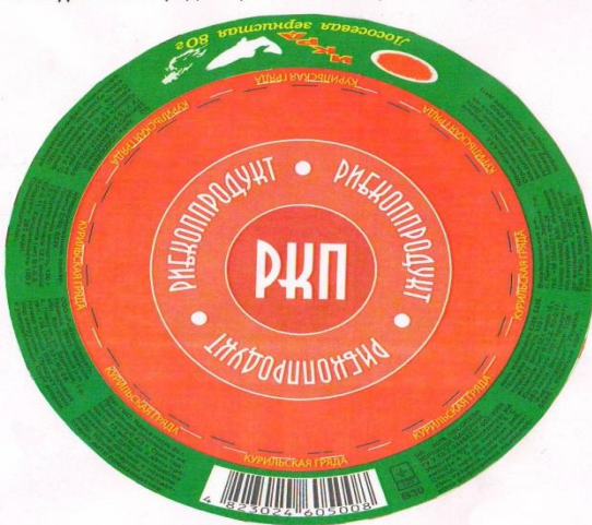
17. "Курильська грядя" Ікра лосося зерниста червона ж/б 80 г