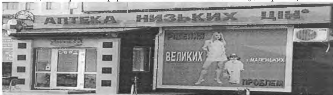
Фото 1. Аптека ТОВ «Аптека низьких цін ТМ»

ТОВ «Аптека низьких цін ТМ» поширює на зовнішніх поверхнях будинків (фасадах) аптечних закладів Товариства інформацію «Аптека низьких цін ®» (див. фото 1).