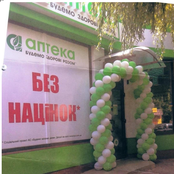
Фотокопія 1. Зображення фасаду Аптеки, надіслане Заявником

Фасад Аптеки оформлений у біло-зелених кольорах, біля входу, на білому фоні великими червоними літерами розміщено інформацію «БЕЗ НАЦІНОК*» та нижче примітка «Соціальний проект АС «Будемо здорові разом». Деталі на сайті http://www.bzv.com.ua » (мова оригіналу) (Фотокопія 1).