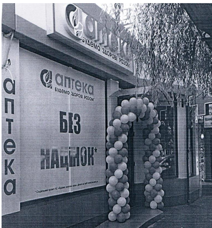
Фотокопія 3. Фотографія поверхні Аптеки, наданої у Листі 2

розпоряджень тощо), які б підтверджували поширення умов Акції на аптеку, що знаходиться за адресою: м. Одеса, вул. Говорова, 10 б, про що зазначено на сайті http://www.bzv.com.ua .