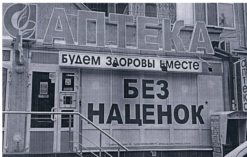
Фотокопія 4. Фотографія поверхні аптеки, м. Одеса, вул. Говорова, 10 б, наданої у Листі 2

Наразі на сайті Товариства http://www.bzv.com.ua/ розміщено інформацію про те, що Акція діє в 6-х аптеках у Одеській області і в 4-х аптеках в м. Києві. Зазначене підтверджується актом встановлення розміщення інформації від 24.11.2016, до якого додано скріншот з сайту Товариства. За посиланням http://www.bzv.com.ua/abn розміщено детальну інформацію про ці заклади, зокрема фотографії їх фасадів із написом «БЕЗ НАЦІНОК*».