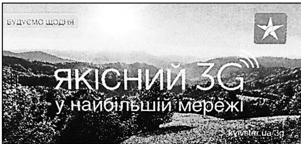
Фотокопія 1. Реклама оператора «Київстар».

Разом з тим, побачивши на початку квітня 2015 року рекламу оператора «Київстар» під назвою «Якісний 3G у найбільшій мережі» (надалі – Реклама) (див. фотокопію 1) Заявник вирішив, що зможе отримувати від вказаного оператора послуги доступу до мережі Інтернет за допомогою рухомого (мобільного) зв'язку стандарту ІМТ-2000 (UMTS), побудованого за технологією третього покоління мобільного зв'язку (3G) (надалі – 3G-зв'язок) з найкращим покриттям у мережі, що має оператор «Київстар», оскільки оператор «Інтертелеком» має мережу переважно у містах, а «Утел» («3Моб») – переважно в обласних центрах. Заявнику швидкісний Інтернет необхідний для роботи, зокрема, виникає постійна необхідність користуватися зазначеною послугою у дорозі та частих відрядженнях. У зв'язку з цим, ним і було придбано стартовий пакет оператора «Київстар».