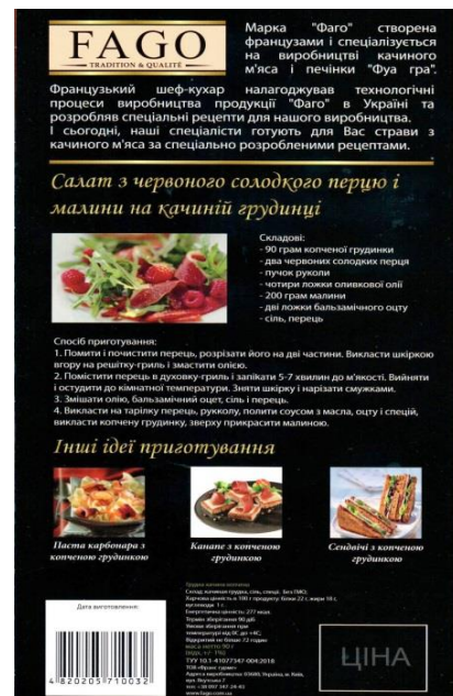
Зображення 8. Упаковка продукту «Качина грудинка копчена»