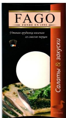
Зображення 1. Упаковка продукту «Качина грудинка в'ялена з сумішшю перців»

Упаковки Продуктів мають прямокутну форму, у верхній частині розміщено позначення «FAGO» (за повідомленою Товариством інформацією, наразі це позначення знаходиться у процесі реєстрації як торгової марки), нижче розміщено назви продуктів, зображення головного убору кухаря, який забарвлено в кольори прапора Франції, напис «Від французького шефа». В нижній частині упаковки розміщено зображення продуктів та позначення породи качок «мулард» (Зображення 1 і 2).