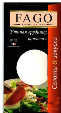
Зображення 2. Упаковка продукту «Качина грудинка копченая»

На зворотній стороні упаковки розміщено інформацію: «Марка «Фаго» створена в 1995 році та спеціалізується на виробництві качиного м'яса і печінки «Фуа гра». Усі каченята привезені з півдня Франції і вирощені в Україні за найкращими французькими технологіями на натуральних кормах. «Фаго» представляє також страви з качиного м'яса, приготовані нашим шеф-поваром за традиційними рецептами Франції» (мова оригіналу). Нижче розміщено рецепти приготування, а також зазначено інформацію про: калорійність, масу, дані щодо виробника продуктів, технічних умов, за якими виготовлені Продукти, строки придатності та умови зберігання (Зображення 3 і 4).