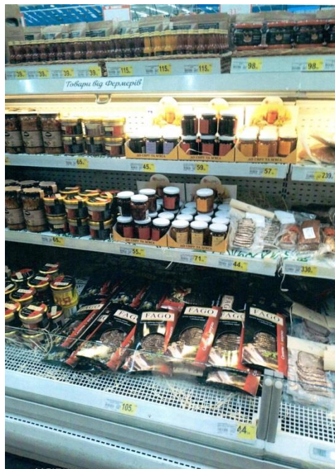
Зображення 10. Продукт 1 і 2 в нових упаковках, розміщені на вітринах в торгівельній мережі

Відповідно до наведених зображень на нових упаковках Продукту 1 і Продукту 2 Товариство не використовує спірні позначення, а також написи, які прямо чи опосередковано вказують на географічне місце походження складових товару та технології його виготовлення та не підтверджені документально. Зображення 9 та 10 свідчать, що саме такі упаковки використовуються Товариством під час реалізації Продукту 1 і Продукту 2 в торгівельній мережі.