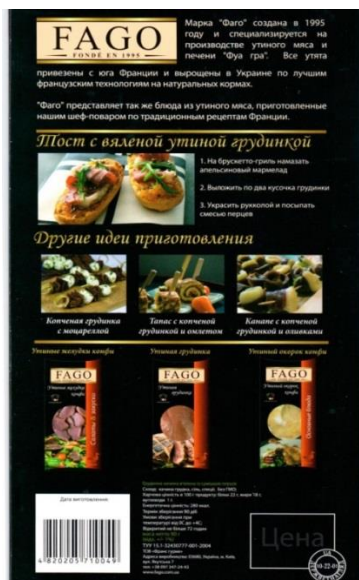
Зображення 3. Упаковка продукту «Качина грудинка в'ялена з сумішшю перців»