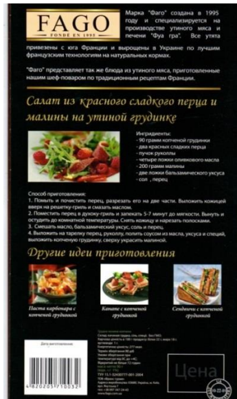
Зображення 4. Упаковка продукту «Качина грудинка копчена»

Згідно з інформацією, наданою Листом, упаковки Продукту 1 і Продукту 2 виготовлені товариством з обмеженою відповідальністю «СВД-Прінт», розробником макетів (текстів та дизайну), а також особою, яка несе відповідальність за розміщену на упаковках інформацію, є ТОВ «Франс гурме».