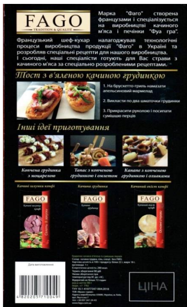
Зображення 7. Упаковка продукту «Качина грудинка в'ялена з сумішшю перців»