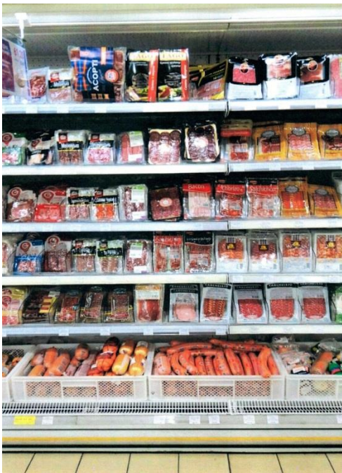
Зображення 9. Продукт 1 і 2 в нових упаковках, розміщені на вітринах в торгівельній мережі