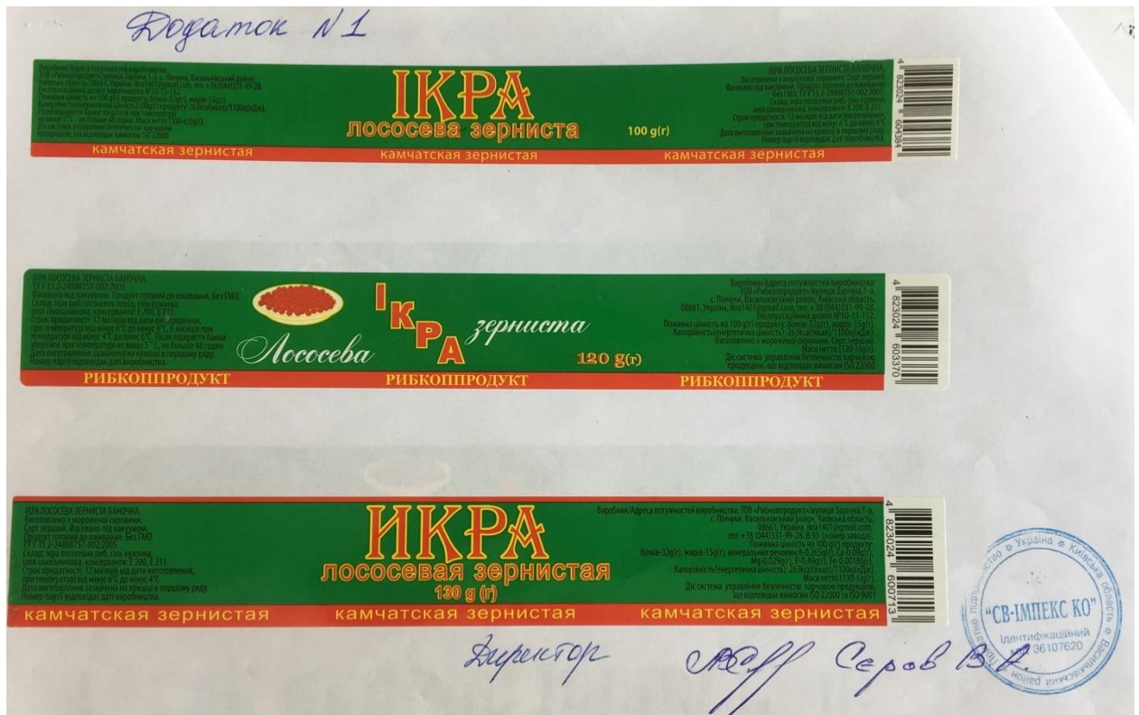
Фотокопія 5. Зразки нових етикеток.