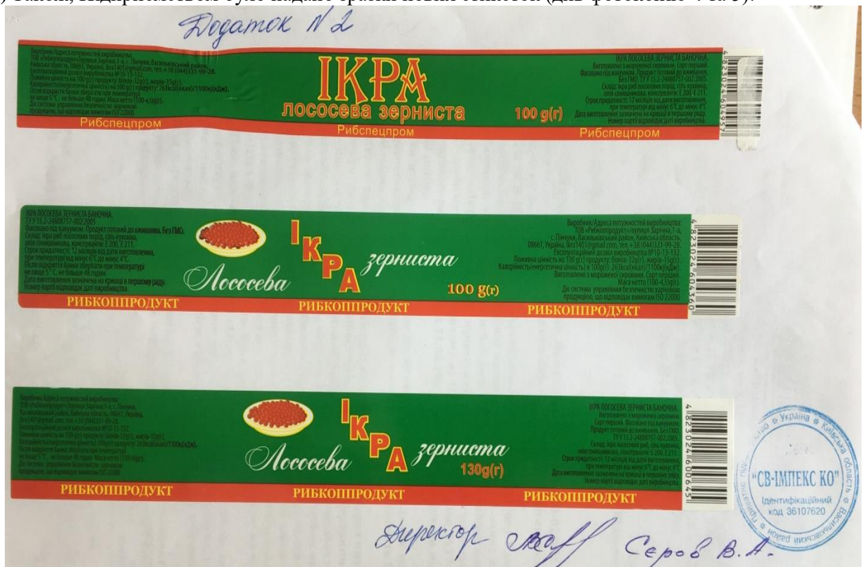
Фотокопія 4. Зразки нових етикеток.