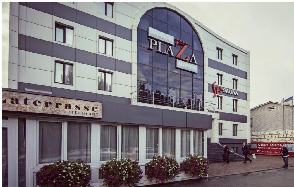
Фотокопія 1. Фасад готелю «Нивки Плаза»

фасаді готелю «Нивки Плаза» за адресою: 02000, м. Київ, вул. Маршала Гречка, 5 (див. фотокопія 1), а також у мережі Інтернет, зокрема на веб-сайті Відповідача за посиланням: http://www.nyvkyhotel.com/ua/ (див. фотокопія 2), інформацію про категорію зазначеного готелю, а саме - зображення «****» (чотири зірки).