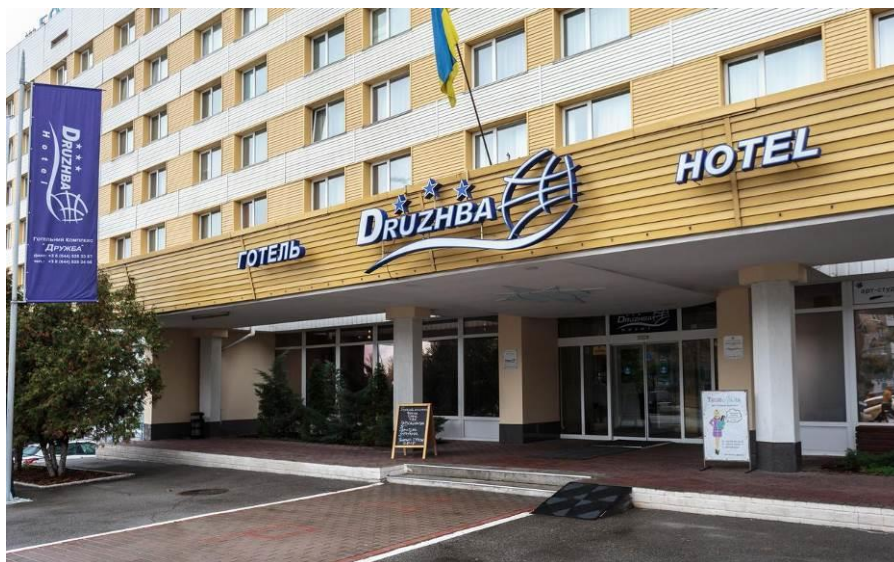
Фотокопія 1. Фасад готелю «Дружба»