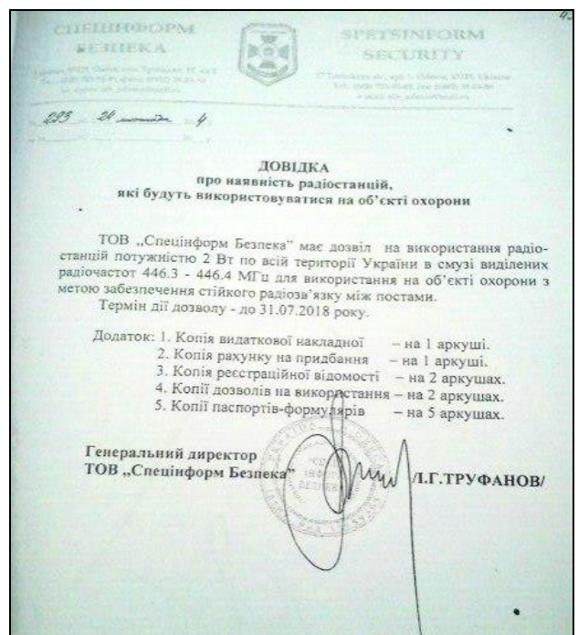
Фотокопія 7. ТОВ «Спецінформ Безпека»

Проаналізувавши зазначені документи встановлено, що за своїм змістом та способом оформлення вони практично однакові, а саме: