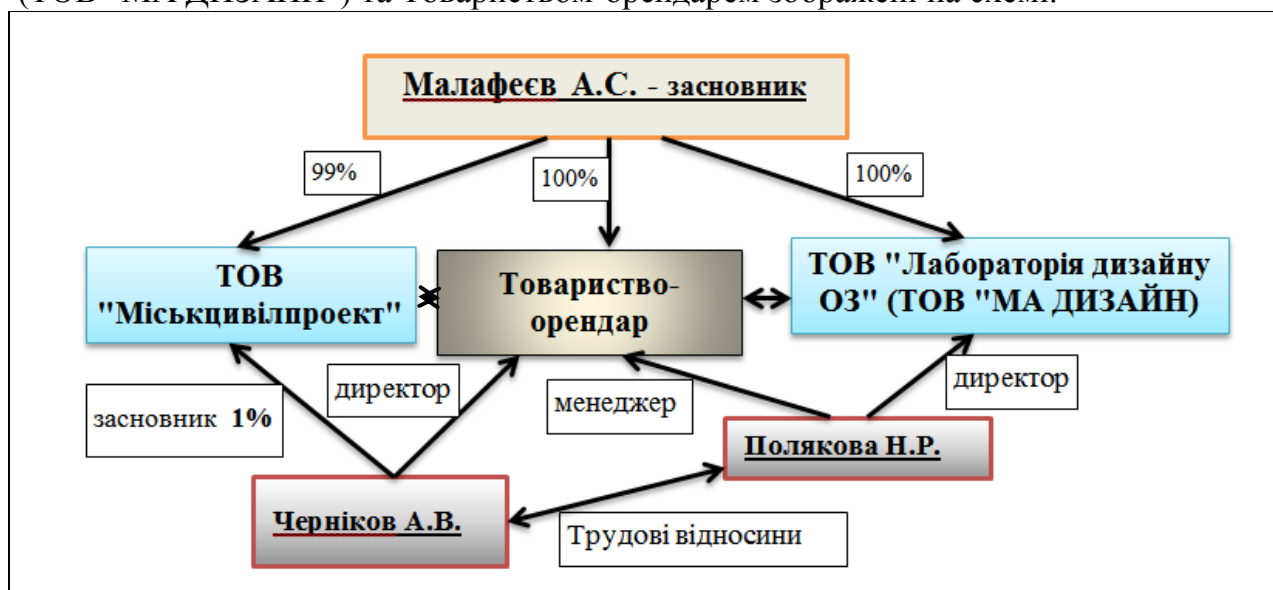
Схема пов'язаності Учасників Процедури закупівлі

Відносини між ТОВ "Міськцивілпроект", ТОВ "Лабораторія дизайну ОЗ" (ТОВ "МА ДИЗАЙН") та Товариством-орендарем зображені на схемі.